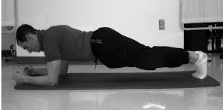
Slika 2: Prikaz testa za procjenu statičke jakosti fleksora trupa (66)